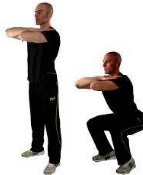
FLEXION OU SQUAT