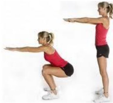
FLEXION OU SQUAT

PAO 5 TSUKIS D/G – 5 MAE GERI D/G – 5 MAWASHI GERI D/G