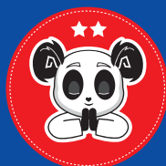
Niveau 2 2 ans de pratique COMPREHENSION