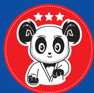
Niveau 3 3 ans de pratique MAITRISE TECHNIQUE