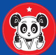
Niveau 1 1 an de pratique PLAISIR DE FAIRE

Le système de progression est déterminé selon des périodes. L'assiduité de l'enfant est le critère prépondérant pour son évolution. A chaque niveau l'enfant recevra une étoile avec une posture du panda qui sera différente pour chaque niveau proposé.